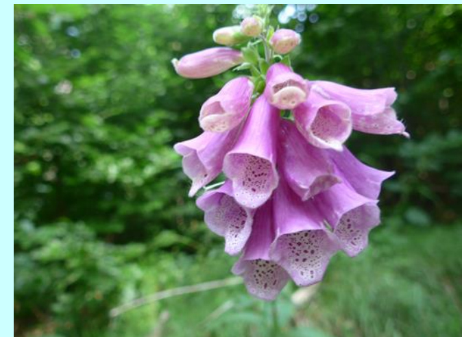
Oben: Fingerhut am Naturtrail „Rund um den Rimdidim“