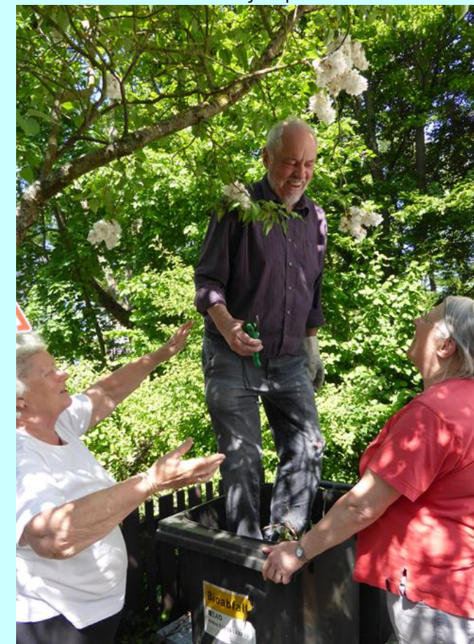
Unten: voller Einsatz beim Frühjahrsputz am Stadtheim