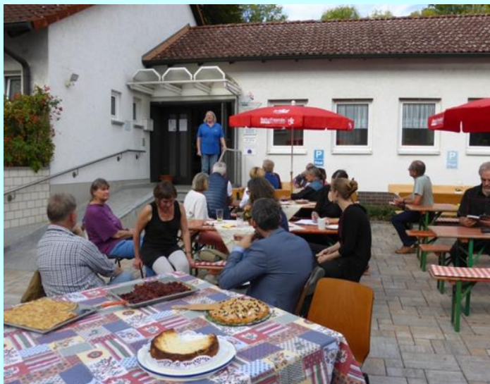
Solidaritätsfest am Stadtheim am 6. Oktober 2018

Die NaturFreunde Deutschlands sind ein sozialökologischer und gesellschaftspolitisch aktiver Verband für Umweltschutz, sanften Tourismus, Sport und Kultur. Wir engagieren uns ehrenamtlich für die nachhaltige Entwicklung der Gesellschaft. Wir wollen mithelfen an der Schaffung einer Gesellschaft, in der niemand wegen seiner Hautfarbe, Abstammung, politischen Überzeugung, seines Geschlechts oder Glaubens wegen benachteiligt oder bevorzugt wird und in der alle Menschen gleichberechtigt sind und sich frei entfalten können. Kriege und Zerstörung der Umwelt müssen ein Ende haben. Daran arbeiten wir.